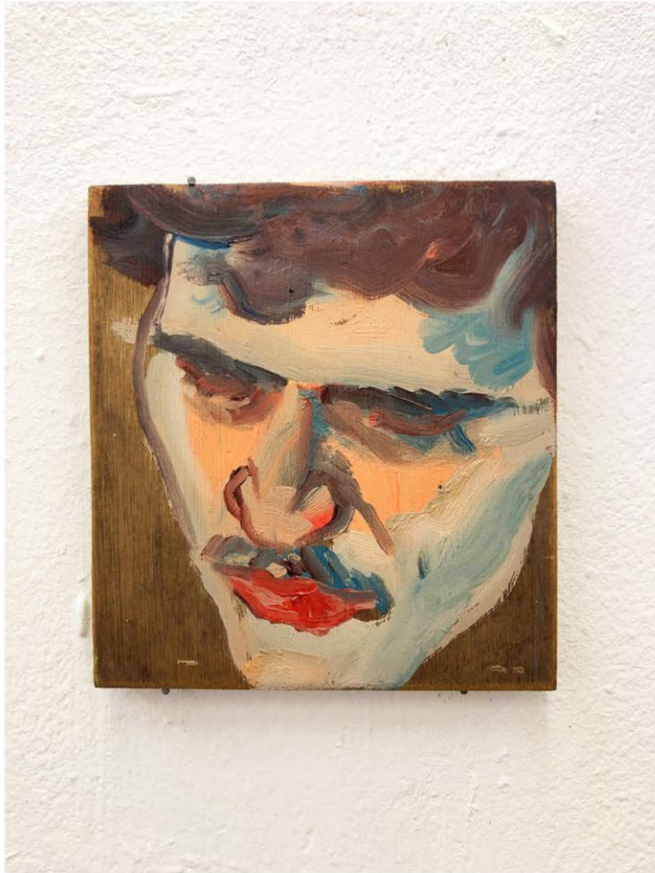
Mathis 12 , 2022 Huile sur panneau 16,2 x 14,2 cm