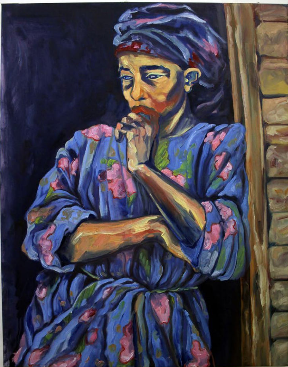
Robe à fleurs, 2023