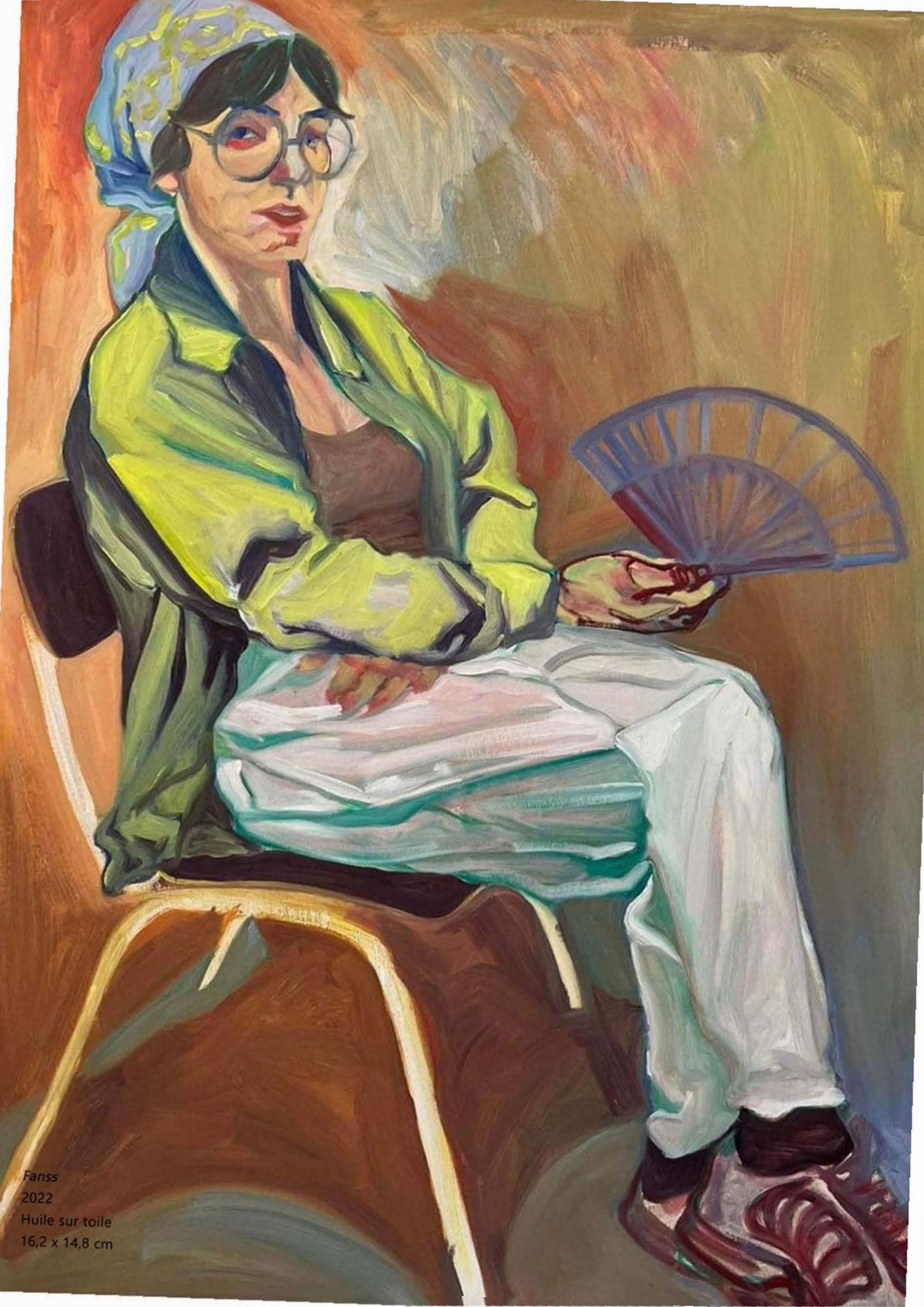
Fanss 2022 Huile sur toile 16,2 x 14,8 cm