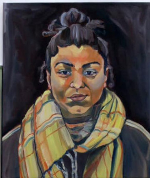
Mélinda , 2023 Huile sur toile 70 x 57 cm