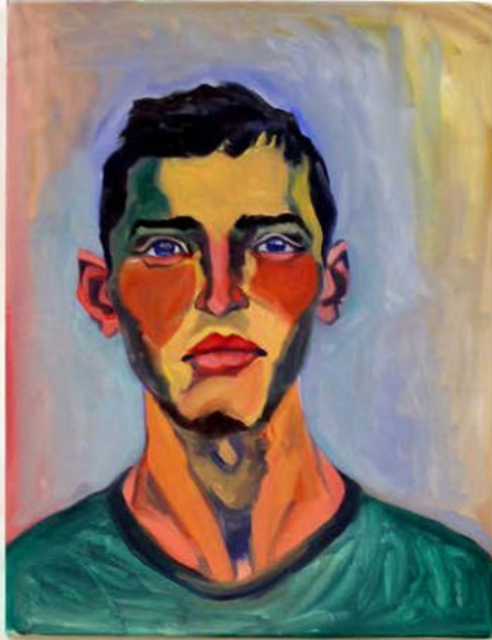
Rémy, 2022 Huile sur toile 72,5 x 57,5 cm