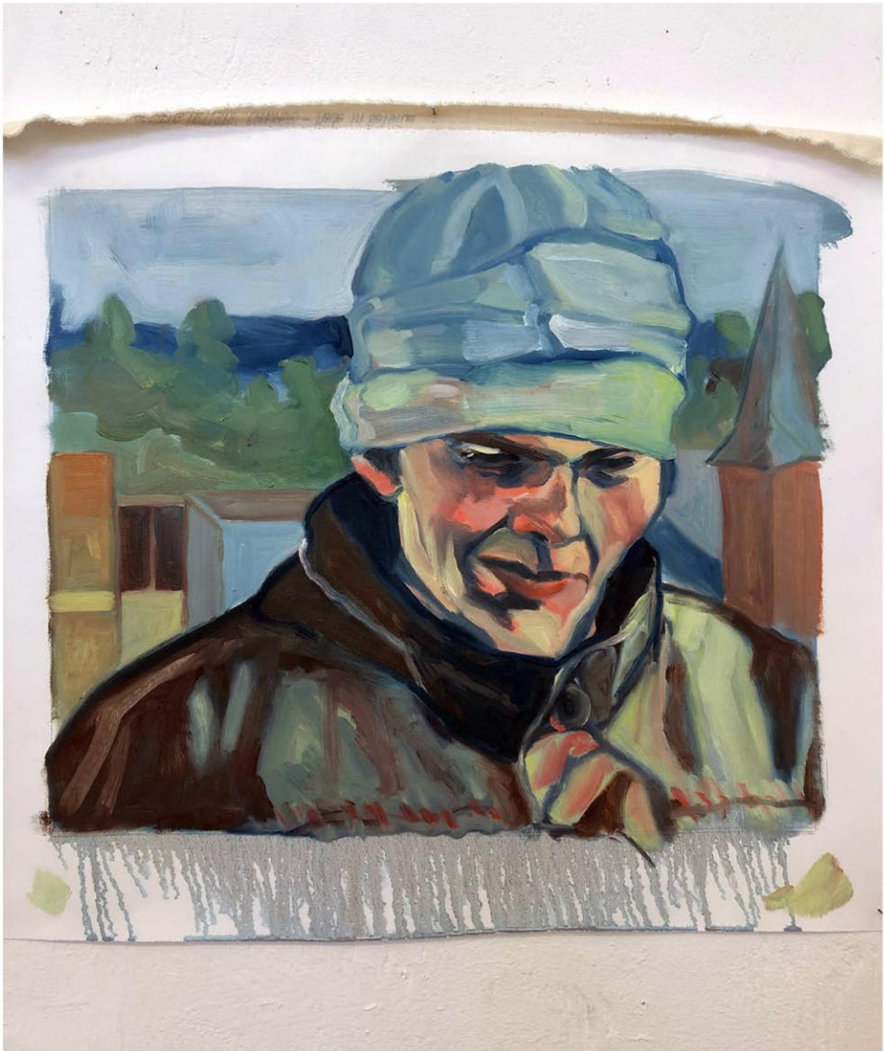
Mathis, 2022 Huile sur toile 43 x 54 cm