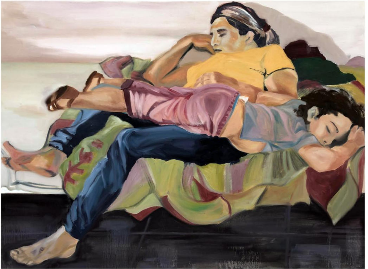
Marseille, 2022 Huile sur toile 93 x 128 cm