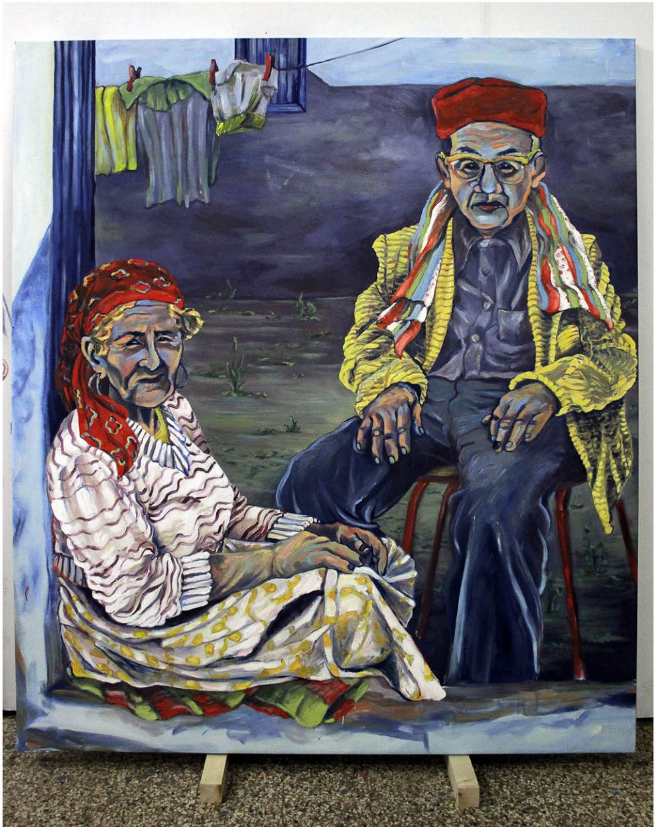
Motifs marocains, 2023